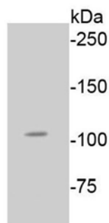
Fig. 1. Western blot analysis of Phospho-Rb(Ser807) on A549 cell lysates using anti-Phospho-Rb(Ser807) antibody at 1/1,000 dilution.